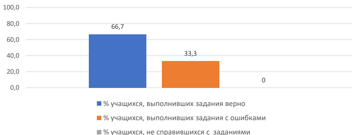
Рисунок 3. Основные результаты ДР по английскому языку

На рисунке 3 представлены основные результаты ДР по английскому языку в Партизанском муниципальном округе.